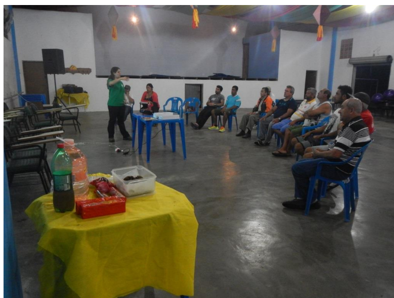
Figura 1. Reunião realizada em 06/09/2016 no Salão da Associação Amigos de Pedrinhas.